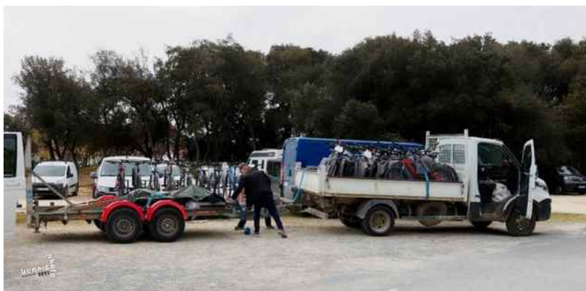
Fête du Vélo à Marigny-Brizay le 14 mai